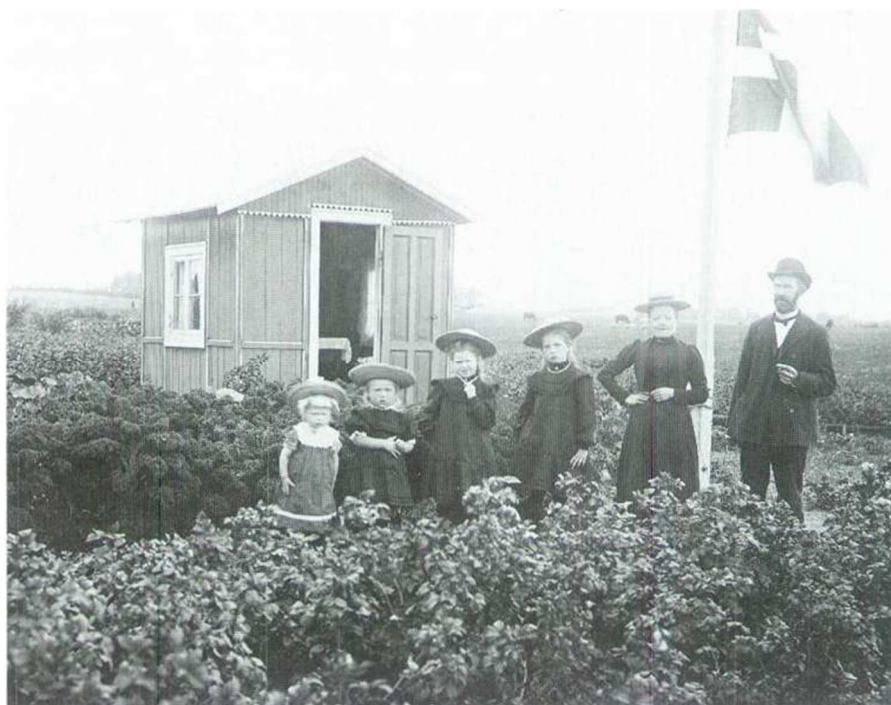
Billedet er fra 1905 – der er sandelig sket noget siden!