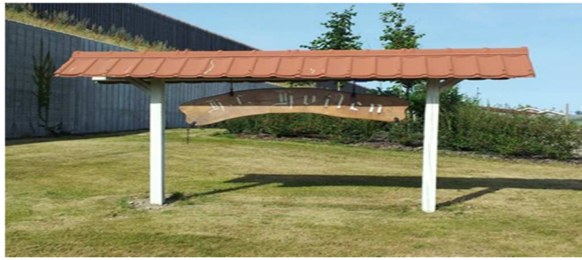
Hf. Hvilen, ww.hvilen.dk

Så er der atter gået et år tiden løber med hastige skridt på både godt og ondt H/F Hvilen har også måtte sande at det ikke har været uden problemer, der blev afholdt ekstraordinær generalforsamling d. 29-08-2016 med ny formand og kasser, der har været rigtig mange ting at tage hånd om.