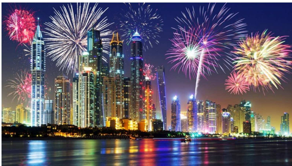
Nytår i Dubai – UAE Mellemøsten