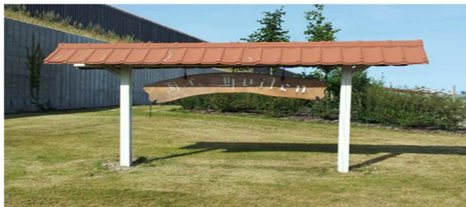
Hf. Hvilen, ww.hvilen.dk